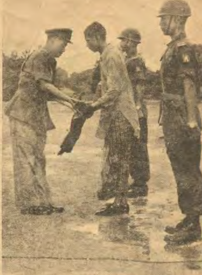
မုဂ္ဂဟာစ်ခေါင်းဆောင် ရေဒ်ဘီဟူလာက မုဂ္ဂဟာစ်အလို တပ်ဆင် ထားသော သေနတ်အား ဗိုလ်မှူးချုပ်အောင်ကြီးလက်သို့ ပေးအပ်နေစဉ်

ဗိုလ်မှူးချုပ် အောင်ကြီးသည် စစ်ရေးပြတပ်ဖွဲ့နှင့် လက်နက်ချ အလင်းဝင်လာသော ရဲဘော်များအား ကြည့်ရှု စစ်ဆေးပြီး မုဂ္ဂဟာစ် ခေါင်းဆောင် ရေဒ်ဘီဟူလာက မုဂ္ဂဟာစ်အလို တပ်ဆင်ထွားသော သေနတ်ပေးအပ်သည်ကို လက်ခံယူပြီးနောက် မိန့်ခွန်းစကားပြောကြားရာ တွင် မေယုနယ်ခြား ခရိုင် အတွင်းတွင် နေထိုင် ကြစသာ ရိဟင်ဂျာ အမျိုးသား များသည် ပြည်ထောင်စု မြန်မာနိုင်ငံတော် သားများဖြစ်ကြသည်အတိုင်း ခိုင်ငံတော်၏ သစ္စာကိုစောင့်သိ ရှိစေ ကြတိုလိုကြောင်း၊ မေယုနယ်ခြားခရိုင်သည် ပြည်ထောင်စုအတွင်းမှာရှိသည့် အတွက် မေယုခရိုင်အတွင်းတွင်နေထိုင်ကြသော ရိဟင်ဂျာ များသည် လည်း ပြည်ထောင်စုအတွင်း လူမျိုးစုတစ်ခု ဖြစ်သည်ကို သဘောပိုက်ထားကြစေလိုကြောင်း၊ မြန်မာ၊ ရခိုင်၊ မုဆလင်၊ ရိဟင်ဂျာ ဟူ၍ခွဲခြားဘဲ ပြည်ထောင်စုသား ဆွေမျိုးသားချင်းအနေ