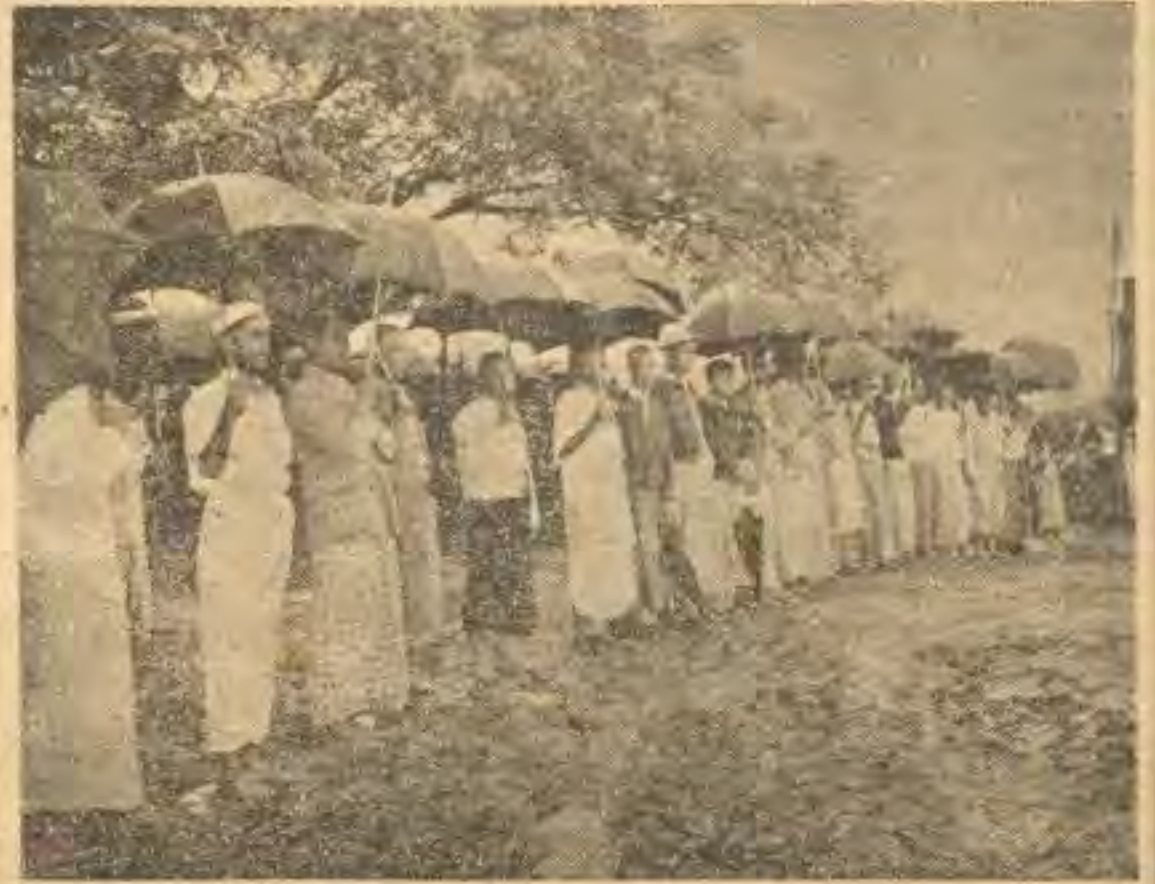
မိုးကြီးသည် ထန်ရွာရွာသည့် အကြားမှာပင် ကြိုဆိုသူ မေယုနယ်ခြား ခရိုင်သားတို့မှာ စိတ်အားမလျော့

ဇူလိုင်လ ၄-ရက်နေ့ နံနက် ၈-နာရီအ ခန့်တွင် ဘူးသီးတောင် မောင်းတောမြို့ရှိ တပ်မတော်စစ်ရေးပြကွင်း၌ ဘူးသီးတောင် တောင်ပိုင်း မူဂျာဟစ်ပါတီ လက်နက် ချ အခမ်းအနားတရပ်ကို စည်ကား သိုက်မြိုက် စွာ ကျင်းပခဲ့ကြသည်။ ထိုအခမ်း အနားသို့ ရန်ကုန်မှ ရောက် ရှိ လာသော ဗိုလ်မှူးချုပ်