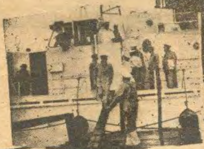
ဘူးသီးတောင်မြို့သို့ဗိုလ်မှူးချုပ်နှင့် အဖွဲ့ဆိုက်ရောက်ကြပြီး -