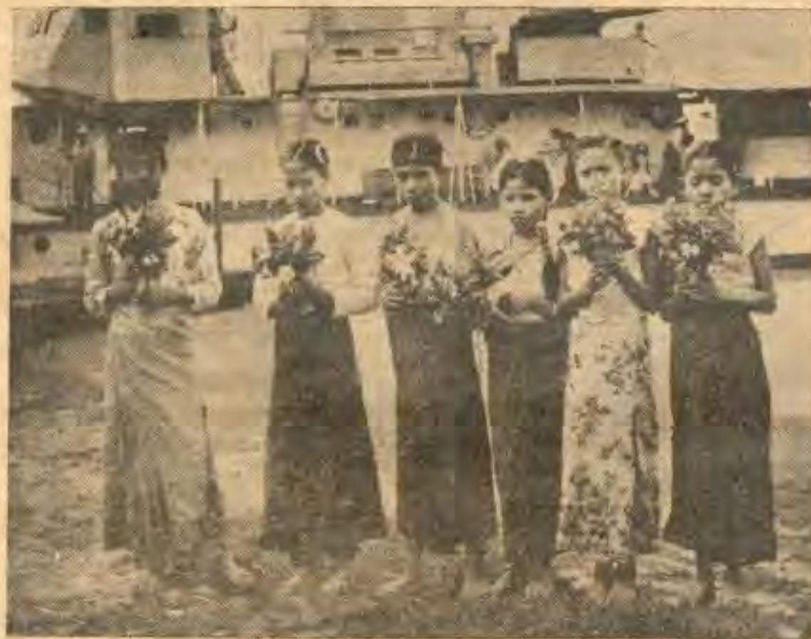
သုစိမ်းမြင်အောင် အိမ်ပြင်ထွက်ရိုးထုတ်စံမရှိခဲ့သည့် ဤမေယုခရိုင်မှ လုံမယ်တို့သည် ယခုသူ တို့နယ်တွင် စိတ်အေးရလေပြီတော့ဟု ဝမ်းသာလွန်း၍ မမောမပန်း မရှက်မကြောက်နိုင်၊ ပန်းစည်း လေးတေကိုယ်စီကိုင်၍ လက်နက်အခမ်းအနားသို့လာရောက်သည့် ခုကာကွယ်ရေးဦးစီးချုပ်(ကြည်း) နှင့် အစွဲဝင်တို့အား မြင်မြိုင်ကြိုဆိုကြရှာသည်။

ဖြစ်ခင်အရင် အခြေအနေဖြစ်တယ်။ စစ်ပြီး နောက်ပိုင်းမှာဆိုရင် ဒါမျိုးဟာ မရှိတော့ ဘူး။ ပါကစ္စတန်နဲ့ အယူအဆသဘောထား ဟာဆိုရင် အင်မတန်မှန်တယ်။ ဥပမာတခု ကျီးကျွန်းကိုစွဲဆိုရင် သူတို့က တောင်း တောင်မတောင်းဘူး။ ကျီးကျွန်းကိုတောင် မတောင်းဘဲနဲ့ ဒီအရှေ့ ပါကစ္စတန်ထဲကို မေယုခရိုင်ကပေါင်းချင်တယ် ဆိုတာမျိုးကို တော့ ပါကစ္စတန်က စဉ်းတောင်စဉ်းစားရဲ မှာမဟုတ်ဘူး။ စဉ်းလဲမစဉ်းစားပါဘူး။ ဒီလို ဘဲတရပ်ပြည်မှာရှိတဲ့လူတွေကလဲ ဒီဘက်မှာ ရှိတဲ့ကချင်တွေဟာ သူတို့ပြည်ထဲက ကချင် တွေနဲ့ အမျိုးချင်းတူတယ်ဆိုပြီး ကချင်ပြည် နယ်ကို ယူနန်ပြည်ထဲထည့်ပါလို့ မတောင်း နိုင်ဘူး။ ဒီခေတ်မှာ ဒါမျိုးမရှိဘူး။ အရင် တုန်းကတော့ ဟုတ်တယ်။ မမာ ပြည်မက တချို့ကလဲ ဒီမှာရှိတဲ့လူတွေကို တိုင်းရင်း သားလို့ သဘောမထားခဲ့ကြဘူး။ ဒီကလူ တချို့ကလဲ ပါကစ္စတန်ဘက်ကို မြေတလှမ်း လှမ်းနေတယ်ဆိုတာလဲ ဟုတ်သလောက် ဟုတ်တယ်။ အဲဒါတွေ အားလုံး မှားတာ ဘဲ။ ပြည်မက တချို့လူလဲမှားတယ်။ ဒီမှာရှိ တဲ့လူတချို့လဲမှားတယ်။ အဲဒီတော့ ဒီနေ့ ဒီအချိန်က စပြီးတော့ ကျွန်တော် ပွင့်ပွင့် လင်းလင်းပြောချင်ပါတယ်။ မေယုခရိုင်ကို ကျွန်တော်တို့က ပြည်ထောင်စုထဲမှာ ရှိတဲ့ လူနည်းစု လူမျိုးစုတခုလို့ သဘောထား မယ်။ ဒါတိတိကျကျပြောမယ်။ ဒီကလူတွေ ကလဲမိမိတို့ကိုယ်ကိုမိမိတို့ လူနည်းစုတခုလို့ သဘောထားကြ။ အဲဒါမှလဲ ဒီတိုင်းပြည် မှာ ဒီရပ်ရွာအေးချမ်းသာယာတဲ့သဘော ကို ရောက်မယ်။