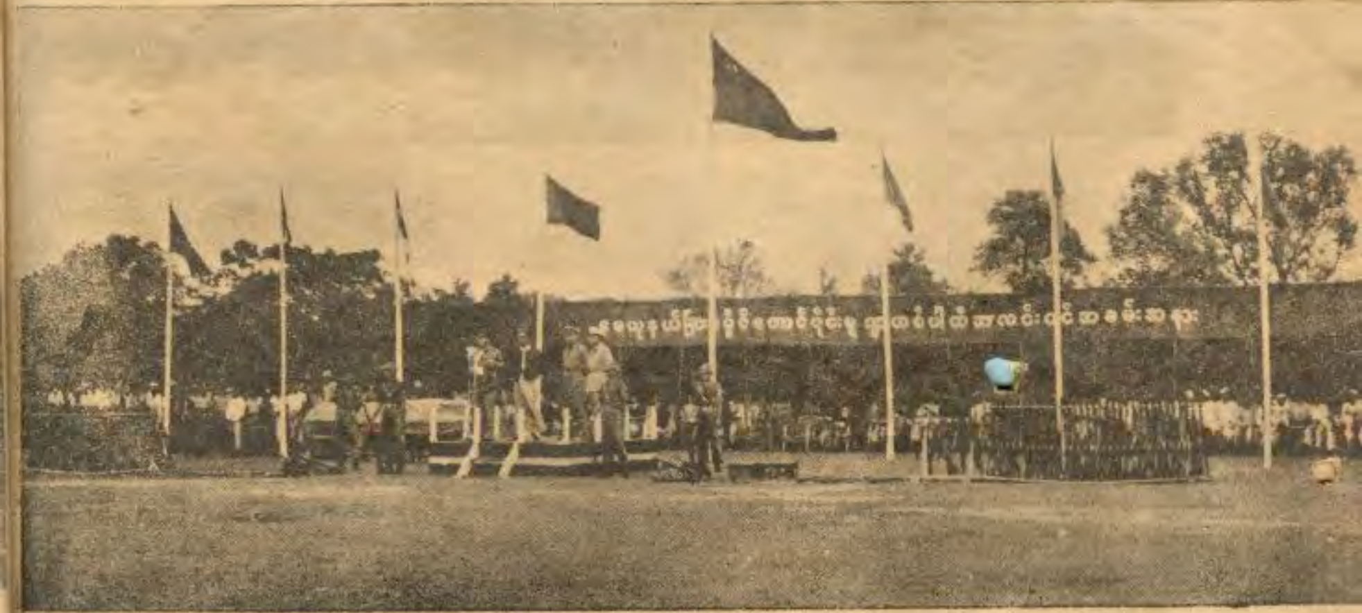
မေယုခိုင်လူထုကို မြန် လည်ကျေးဇူးဆပ်လိုက်ခြင်းဖြစ်သော မူဂျာဟစ်လက်နက်ချပွဲတွင် ဤသို့ တခမ်းတနား အားရဘွယ်ပင်တွေ့ရသည်။

တွေရှိနေတယ်။ ဆွေမျိုးတွေရှိနေပေမယ့်လို့ ဟိုဘက်မှာရှိတဲ့ လူတွေဟာ ပါကစ္စတန်ဘဲ ဖြစ်ရမယ်။ ဒီဘက်မှာရှိတဲ့ လူတွေဟာလဲ မြန်မာပြည်ထောင်စုသားတွေဘဲ ဖြစ်ရမယ်။ ဒီအတိုင်း နယ်စပ်မှာ နေတဲ့ လူတွေဟာ တိတိကျကျ ရှင်းရှင်းလင်းလင်း စိတ်ကို ယတိပြတ်ထားဖို့ လိုတယ်။ ဥပမာ ကချင်ပြည်နယ်ကိုကြည့်ရင် တချို့ ကချင်ပြည်နယ်သူနယ်သားတွေရဲ့ ဆွေမျိုးတွေဟာ ဟိုဘက်တရုတ်ပြည်ထဲမှာ ရှိနေတယ်။ ရှိပေမယ့်လို့ ဟိုဘက်ကမ်းမှာရှိတဲ့ ကချင်လူမျိုးဟာ တရုတ်ဖြစ်ပြီးတော့ ဒီဘက်ကမ်းမှာ ရှိတဲ့ ကချင်လူမျိုးဟာ မမာဘဲဖြစ်တယ်။ တချို့ဆိုရင် သမီးယောကွမတော်တယ်။ တချို့ဆိုရင် သားမက်ဒူတူနဲ့တော်တယ်။ ဒီလိုတော်တာ တွေ ရှိနေပေမယ့်လို့ လူမျိုးအား