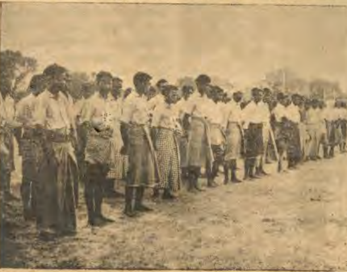
ကိုယ်စီလက်ခံရရှိကြသည့် အကျိလုံချည်များ လဲလှယ်တတ်ဆင်လိုက်သောအခါ မူဂျာဟစ် တို့မှာ စမ်းပန်းတသာနှင့် ဤသို့ရှိကြပေ၏။

စီးပွားရေး ကိစ္စနဲ့ပတ်သက်ပြီး ပြောရ မယ်ဆိုလို့ရှိရင် မေယုခရိုင်မှာ ပထမဦးဆုံး မွေးမြူရေးလုပ်ငန်းတွေ ကျွန်တော်တို့ အ သက်သွင်းပါမယ်။ ဒီအရပ်ဒေသမှာဆိုရင် ကြက်မွေးတာတို့၊ ငါးမွေးတာတို့၊ နွားမွေး တာတို့ကို ကျွန်တော်တို့အားပေးမယ်။ ဒီ ကိစ္စနဲ့ပတ်သက်လို့ရှိရင် ဒီမှာ ဗိုလ်မှူးကြီး ရဲခေါင်အဖွဲ့ရှိတဲ့ ကျွန်တော်တို့ နယ်ခြား ဒေသအုပ်ချုပ်ရေးတာဝန်ခံတွေက ဒီကိစ္စနဲ့ ပတ်သက်ပြီးတော့ အခါအားလျော်စွာ အ သေးစိတ်ရှင်းပြကြပါလိမ့်မယ်။ ကျွန်တော်