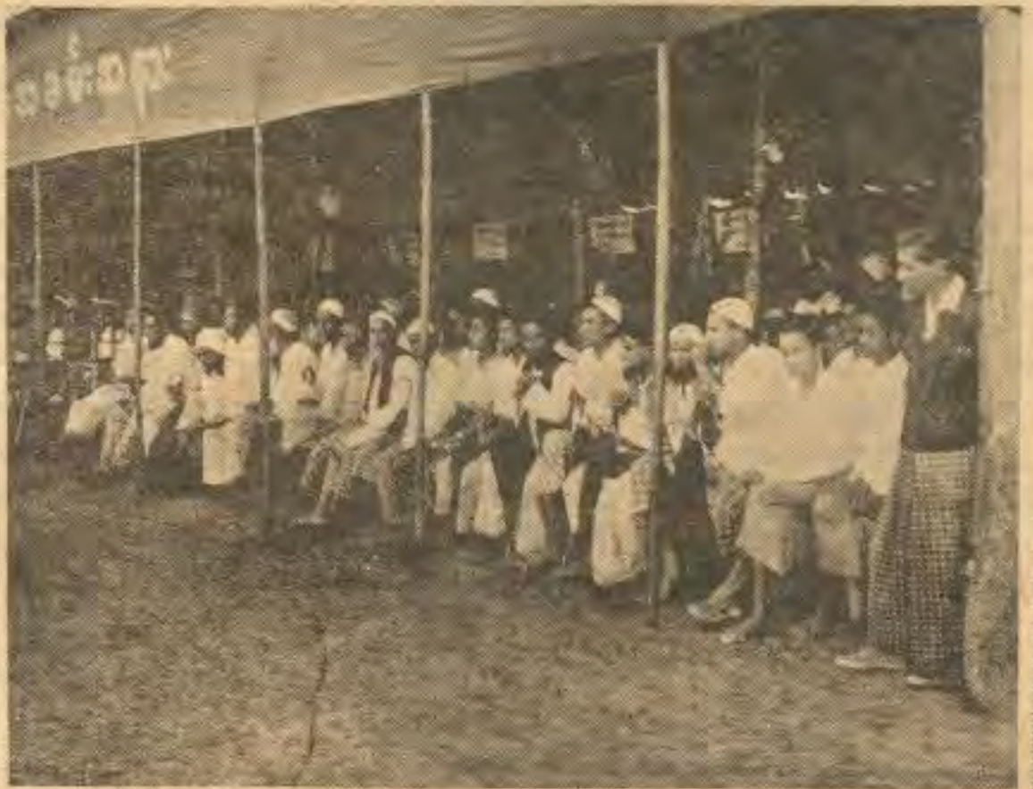
ဘူးသီးကောင်ကောင်ပိုင်း မုဂျာဟပ်များ လက်နက်ချရေးတွင် တပ်မတော်အား မော်လဝီ ဆရာကြီးများနှင့် လူထုကူညီခဲ့ကြသည်။

တဲ့ လုပ်ငန်းတွေကို နယ်ခြား ဒေသရှိ အမှုထမ်း အရာထမ်းအားလုံးတို့ ဟာ ကမ်းစင်စွာနဲ့ နိုင်ငံတော် တာဝန်ကို ထမ်းဆောင်ကြတို (၄) နယ်လူထု အပေါ်မှာ အစိုးရအရာထမ်း အမှုထမ်း များ နဲ့ လက်နက် ကိုင် တပ်မတော်၊ ရဲစတဲ့ လက်နက်ကိုင်များရဲ့ ညှဉ်းပန်းမှု လုံးဝမရှိစေအောင် လုပ်တို ဆိုတဲ့ အချက်များနဲ့ ကြပ်မတ်လုပ်ဆောင်ကြပါတယ်။