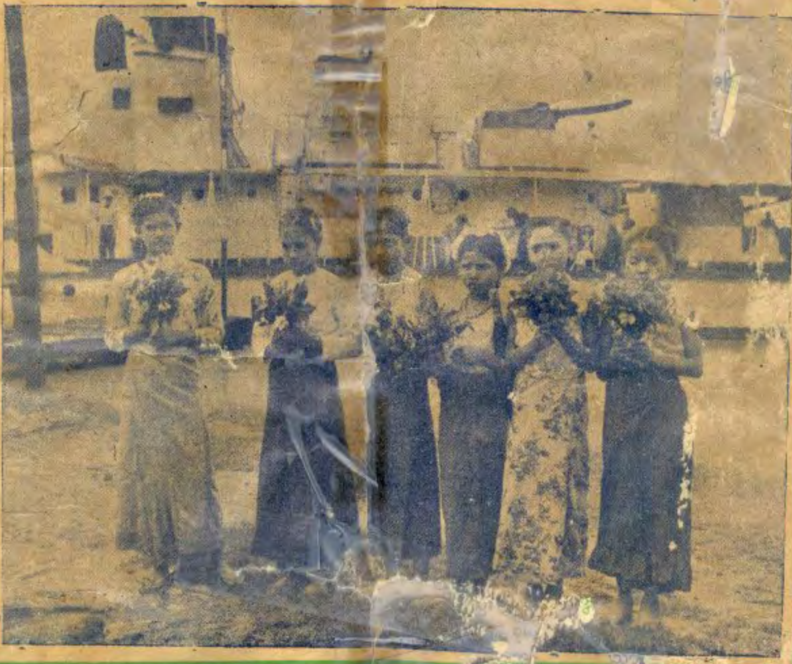
မေယု အထူးသုတ် စာပေစာင်