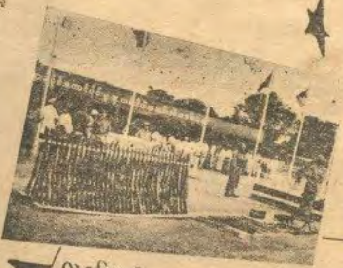
လက်နက်များချအပ်အပြီးတွင်