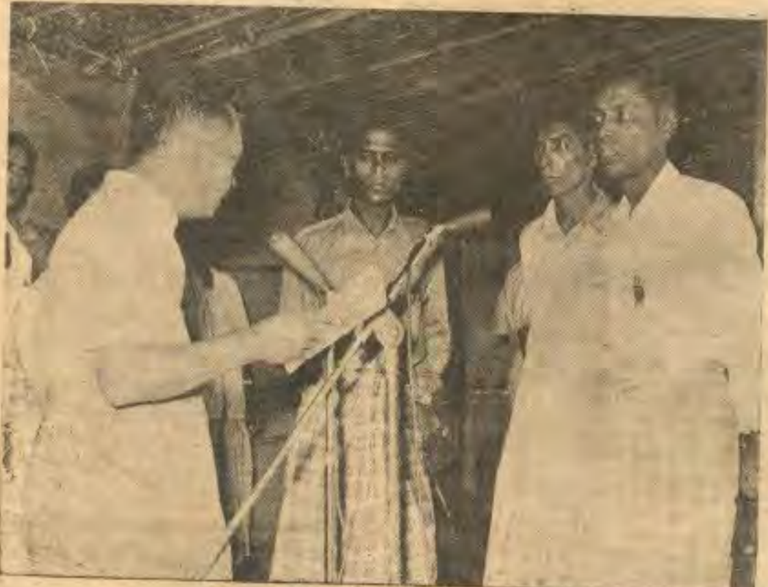
မူဂျာဟစ်ခေါင်းဆောင်ရော်ဘီဟူလာနှင့် အပော်နှစ်ဦးတို့မှာ မြန်မာ့အသံဒုတိယ အစီအစဉ်မှ ကိုယ်စားလှယ်မေးသမျှ စေ့စေ့ငှငှပြောဆိုကြသည်။

တဲ့ ပါးစပ်ပေါက်ကပိုများတဲ့အတွက်ဒီနယ် ဟာအလိုလိုဆင်းရဲမှာဘဲ။ အဲဒီတော့ ဒီနယ် ကလူတွေဟာ တနှစ်မှာ လုံချည်ဆိုလို့နှစ် ထည်သုံးထည်အပြင် ပိုပြီးမလဲနိုင်ဘူး။ ခင် ဗျားတို့ဆင်းရဲတယ်။ အများအားဖြင့်ဆိုလို့ ရှိရင်ဆင်းရဲသားတွေကဒီနယ်မှာများတယ်။ ဒါယေဘုယျ စီးပွားရေး သုံးသပ်ချက်ဖြစ်ပါ တယ်။ ပြည်ထောင်စုရဲ့ အစိတ်အပိုင်းတခု အဖြစ်နဲ့ ပြည်ထောင်စု သားတွေအနေနဲ့ ဒီနယ်က ဆင်းရဲတာကို ကျွန်တော်တို့က ကိုယ်ချင်းစာနာပါတယ်။ အဲဒီတော့ ဒီနယ် ရဲ့ စီးပွားရေးကို ကျွန်တော်တို့ မေယုခရိုင် နယ်ခြားဒေသအုပ်ချုပ်ရေးက တာဝန်ခံပြီး ဒီနယ်ရဲ့ တိုးတက်ရာ တိုးတက်ကြောင်းကို ပြည်ထောင်စုရဲ့ အစိတ်အပိုင်းတခုအနေနဲ့ ကျွန်တော်တို့တာဝန်ခံပြီးလုပ်ဖို့ အစီစဉ်တွေ ရှိတယ်။ အဲဒီတော့ ဒီနယ်မှာရှိတဲ့ လူတွေရဲ့ စီးပွားရေးတိုးတက်အောင်လုပ်ထဲ့နေရာမှာ ကျွန်တော်တို့ နယ်ခြားဒေသ အုပ်ချုပ်ရေး ဌာနက တာဝန်ခံတွေကို ကိုယ်ရဲ့ အုပ်ချုပ် ရေး၊ ကိုယ်ရဲ့ ဆွေမျိုး အရင်းအချာတွေ၊ ကိုယ်ရဲ့ လူကြီးတွေ၊ ကိုယ်ရဲ့ အစိုးရတွေလို သဘောထားပြီးတော့ ခင်ဗျားတို့ပူးပေါင်း ဆောင်ရွက်ကြပါ။ ကျွန်တော်တို့ကလဲဘဲ ဒီဒေသမှာ ဆွေမျိုး အရင်းအချာတွေလို သဘောထားပြီး ဆောင်ရွက်ပါမယ်။