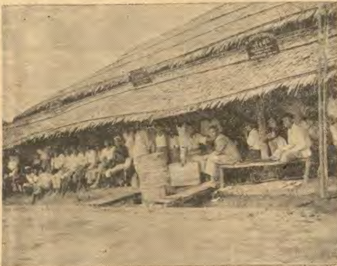
မေယု နယ်ခြားခရိုင် အတွင်းရှိ 'ရွာတရွာမှ ဈေးတစ်ခု၏ ရှင်းပွားမှု...

နောင်ကို ကျန်တဲ့ မူဂျာဟစ် ဖြိုခွင်းရေးနဲ့ ထိရောက်တဲ့ အုပ်ချုပ်ရေးနဲ့ တကွ အခြားလုပ်ငန်းတိုင်းမှာ လူထုကပါ လုပ်တယ်ဆိုတာကို အကောင်အထည်ပေါ်အောင် ကြိုးစားသွားပါမယ်။ ထိရောက်တဲ့ အုပ်ချုပ်ရေးနဲ့ အတူ လုပ်ရမယ်။ လုပ်ငန်းတွေကတော့ နယ်မြေဖွဲ့ ဖြိုးရေးပါဘဲ။ အဓိက ကတော့ စိုက်ပျိုးရေးနဲ့ အိမ်တွင်းစက်မှုလက်မှု လုပ်ငန်းများဖြစ်ပါတယ်။ လမ်းပန်းဆက်သွယ်ရေး ကောင်းအောင် လမ်းများလဲဖောက်လုပ်ရပါမယ်။ အခုဘဲ အနိမ့်ဆုံး လုပ်ငန်းဖြစ်တဲ့ သက်သာ ချောင်ချိရေး ဆိုင်များ ဖွင့် လှုပ် ပေး ဘို့ စီစဉ် နေ ပါ တယ်။ အထူးသဖြင့်တော့ နယ်ခြား ဒေသလူထုတိုးတက်ဖွံ့ဖြိုးရေး လုပ်ရာမှာ တိုင်းပြည် ခေါင်းဆောင် အားလုံးရဲ့ အကြံဉာဏ် တို့ ရယူ ပါ တယ်။ မတိုးတက်သေးတဲ့ ဒေသအတွင်းမှာ နိုင်ငံရေး အရှင် အထွေး