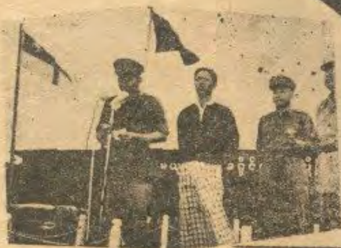
ဗိုလ်မှူးချုပ်က မိန့်ခွန်းပြောကြားခဲ့သည်