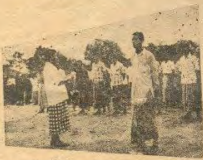
မုဂ္ဂဟာဇာတ်ခေါင်းဆောင်နှင့်အဖွဲ့များတ-