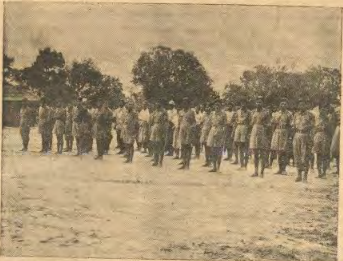
လက်နက်ချဝင်လာကြသည့် ဝတ်စုံတူနှင့်မူဂျာဟစ်များကား မေယုခရိုင်လူထုစိတ်ဝင်စားဘွယ်ပင်

ဒုတိယကျွန်တော်ပြောလိုတဲ့ အချက်က တော့ဒီနယ်ရဲ့ အခြေအနေကို ကျွန်တော်တို့ တပ်မတော်အနေနဲ့ ယေဘုယျသုံးသပ်ချက် ကိုပြောပြပါမယ်။ ခင်ဗျားတို့အင်းလုံးသိတဲ့