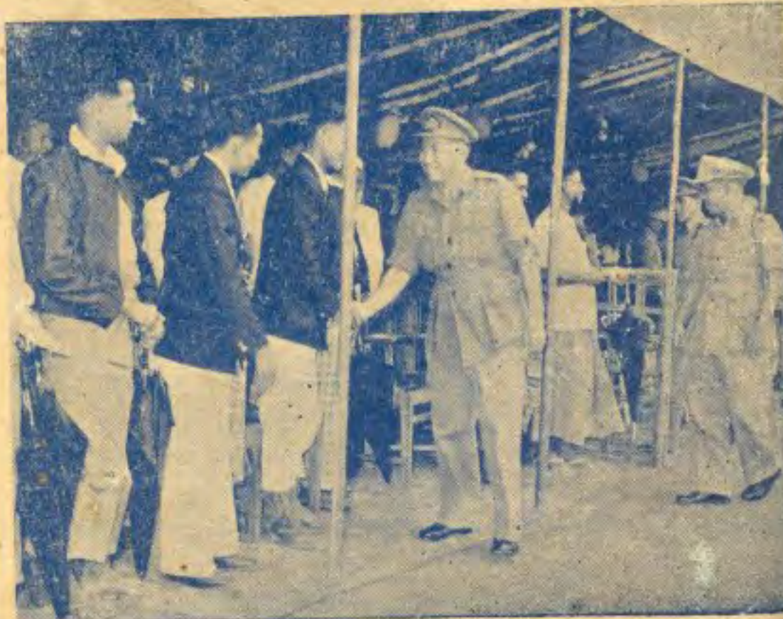
ခေတ်ကွယ်ရေး ဦးစီးချုပ်ကြီးအဖွဲ့ လိုက်လံအားရရွာ မေယုခရိုင် လူထုခေါင်းဆောင်များက ကြိုဆိုကြ၏။

ရန်ကုန်မြို့ ၃၂-လမ်း၊ အမှတ် ၁၈၄၊ ဖြေဆိုမှုနှင့်တို့က... ကာကွယ်ရေးဝန်ကြီးဌာန၊ ပညာရေးနှင့် ဝိတ်တော်ရေးညွှန်ကြားရေးမှူးရုံးမှ ယူတိဝေသည်။