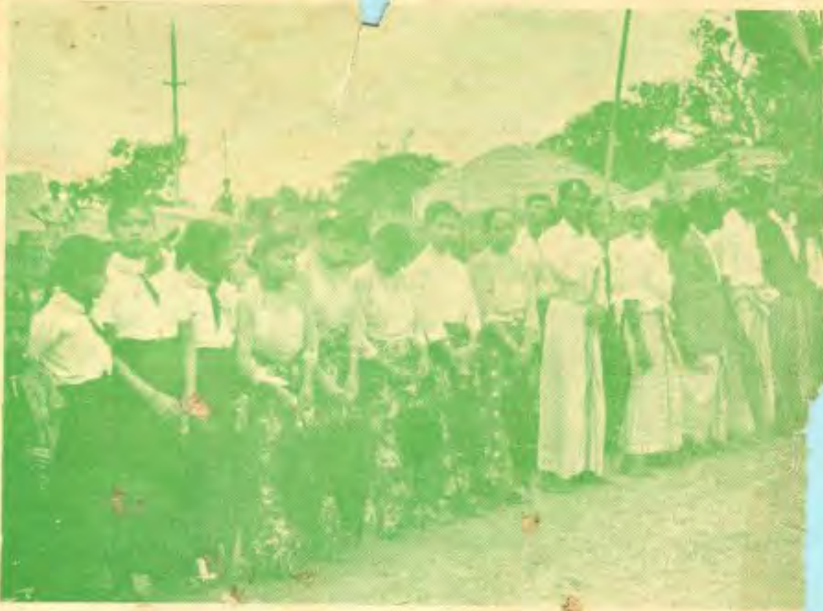
ခေတ်မှီသည့်မေယုခရိုင်နယ်မြေ၏ လုံပျိုငယ်အချို့မှာ ကမ်းထောက်အမျိုးသမီးဝတ်စုံဖြင့် ဤသို့ သိုက်သိုက်ဝန်းဝန်း ငြိမ့်ကြပေသည်။

ထိုနေ့နံနက် ၆-နာရီမှစ၍ မောင်းတောမြို့ပေါ်ရှိ မြို့မိမြို့တများ၊ မော်လဝီဆရာကြီးများ၊ ကျောင်းသူကျောင်းသားများ၊ အလင်းဝင်ရဲဘော်များ တဖွဲ့ဖွဲ့ ခိုးထဲလေထဲမှာ ရောက်ရှိလာကြ၏။ ထို့နောက် မူဂျာဟစ်ပါတီ လက်နက်ချ အခမ်းအနား ဟူသော စာတမ်းရေးထိုးထားသည့် မဏ္ဍပ်အတွင်းဝယ် မော်လဝီဆရာကြီးများ၊ မြို့ပေါ်ရှိ ဂုဏ်သရေရှိ ရိုဟင်ဂျာ မြို့မိမြို့တများ၊ အစိုးရအရာရှိကြီးများ အသီးသီး နေရာယူကြသည်။ ထိုပုဂ္ဂိုလ်ကြီးများရှေ့ရှိ သီးသန့် နေရာတွင် ရန်ကုန်မှရောက်ရှိလာကြသော ပုဂ္ဂိုလ်ကြီးများက နေရာယူကြသည်။ မဏ္ဍပ်ရှေ့တွင် နိုင်ငံတော်အလံ၊ စစ်ရုံးချုပ်အလံ၊ တပ်ပေါင်းစုအလံ၊ ကြို့ခိုင်ရေးအလံ၊ တပ်ရင်းအလံ၊ ရေတပ်အလံ၊ သေနတ်ကိုင်တပ်ရင်းအလံ စသည့် အလံများကို စိုက်ထူလျက် ရှိကြသည်။ ၎င်းအလံတိုင်းကို စိုက်ထူရှေ့မှောက်တွင် မိန့်ခွန်းပြောရန် စင်မြင့်တစ်ခု သီးသန့်ဆောက်လုပ်ပြီး ၎င်းစင်မြင့်၏ ရှေ့တည့်တည့်တွင် ကိုယ်ရံတော် ဂုဏ်ပြုတပ်ဖွဲ့၊ ၎င်းတပ်ဖွဲ့နောက်မှ မူဂျာဟစ်ပါတီ ဥက္ကဋ္ဌ ချော်ဘီဟူလာနှင့် အဖွဲ့ဝင်များ စီတန်းလျက် နေရာယူကြသည်။ စင်မြင့်၏ ဝဲယာ တေးတဘက်တချက်မှာမူ လက်နက်ချအပ်ထားသည့် ဘရင်း၊ စတင်း၊ တောင်မီ၊ အမေရိကန်ရိုင်ဖယ်၊ ဂျပန်ရိုင်ဖယ်၊ အင်္ဂလိပ်ရိုင်ဖယ်စသည့် လက်နက်အမျိုးစုံနှင့် တကွ ခဲယမ်းမီးကျောက်များကို စီတန်းပြသထားသည်။ စင်မြင့်၏ယာဘက်တွင် အလင်းဝင်ရဲဘော်များအတွက် ထောက်ပံ့ကြေးများ၊ ကိုရန်ကျမ်းများ၊ ပန်းကန် ခွက်ယောများ၊ အထည်အလိပ်များ အသင့်ငင်းကျင်းထား