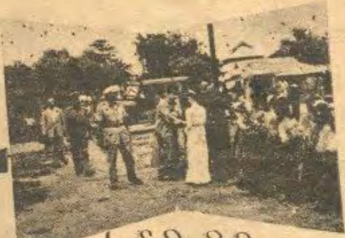
ဤသို့ကြိုဆိုကာ-